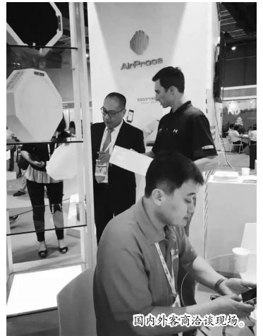
国内外客商洽谈现场。