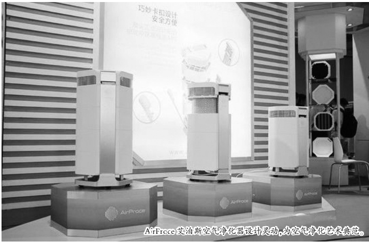
AirProce艾泊斯空气净化器设计灵动，为空气净化艺术典范。

现代家居的智能功能，因此在同类市场上拥有绝对竞争优势。 6月10日-12日，AirProce 艾泊斯净化器亮相上海2015国际水展大会。 在上海国际水展 AirProce 艾泊斯云智能净化器亮相的第一日，艾泊斯，无疑展现了黑马的风格，展会第一日，只能用火爆来形容！除了得到国内外客商的高度认可，同时也得到了业内友商品牌的高度关注！ AirProce 艾泊斯专业的性能和深度人性化智能再加上逼格十足的外观设计，相信在今年的空气净化市场会将黑马的形象逐渐演变成豪强！