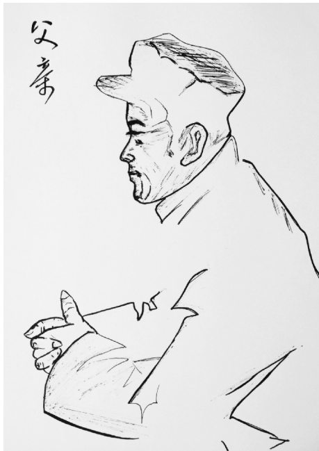
集团办公室 孙燕佳 作品