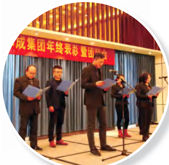
诗朗诵《中华颂》(地基公司)