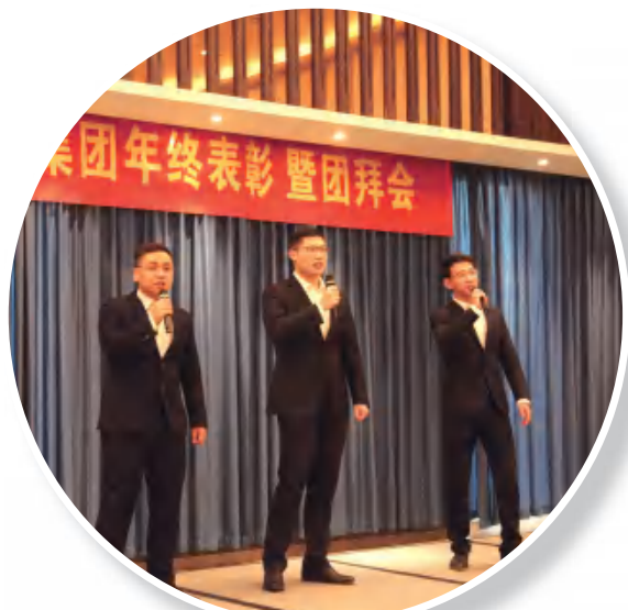
总裁办大合唱《大中国》