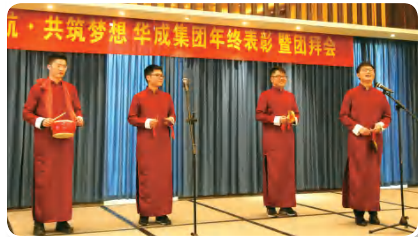
集团小伙表演三句半