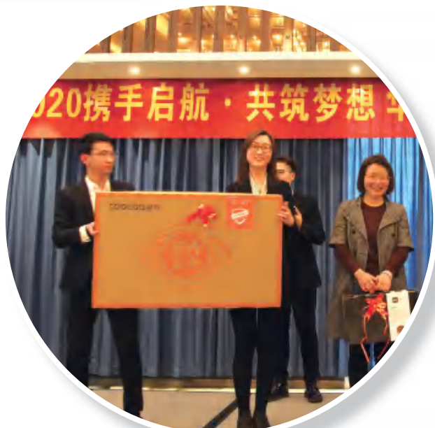
幸运大抽奖和游戏环节大奖好礼精彩纷呈