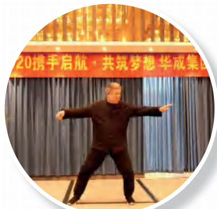
太极表演(建设公司)